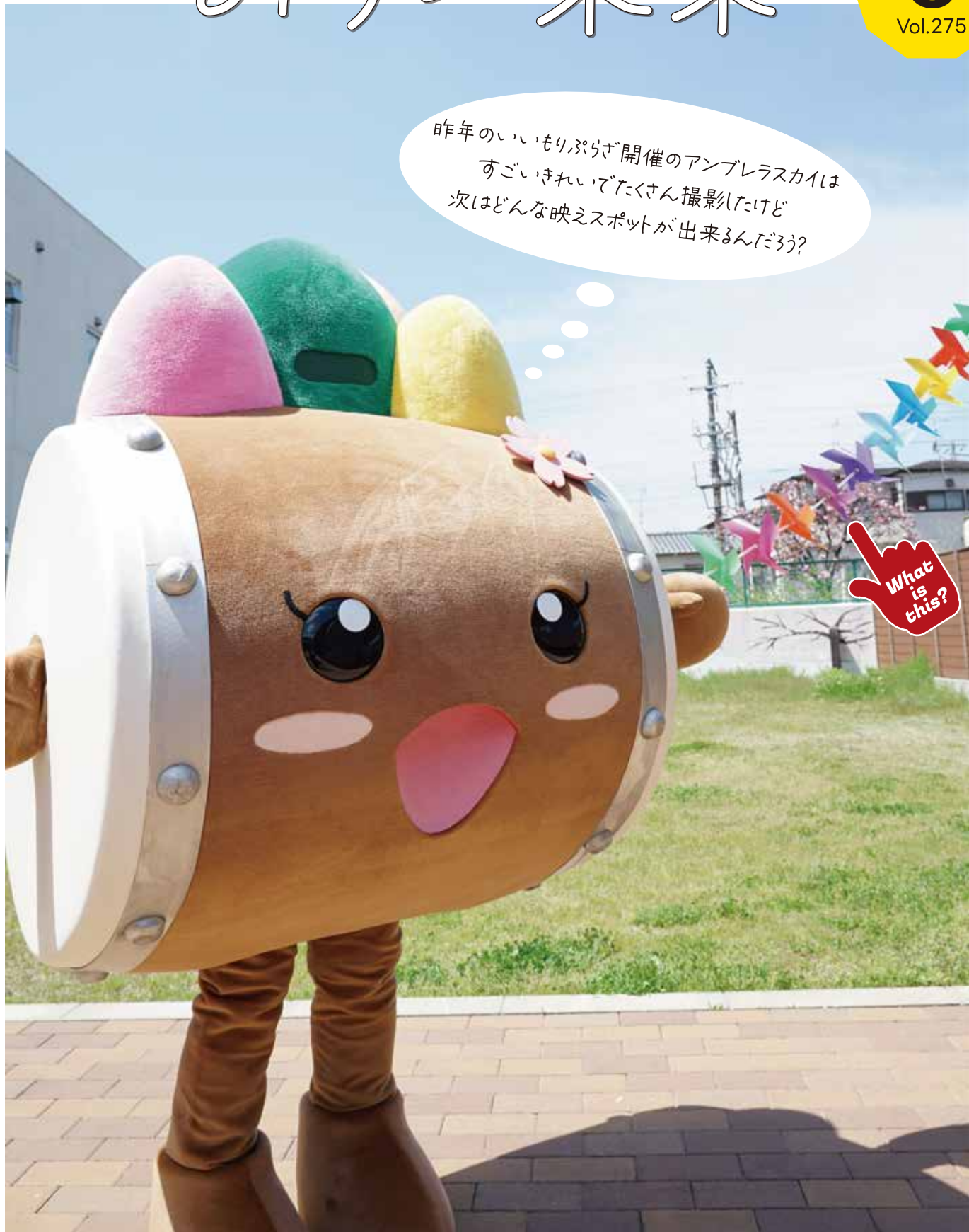
撮影場所: いいもりぶらざ (北条コミュニティセンター 園庭)